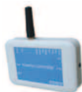
SMS-Box - se information side 73